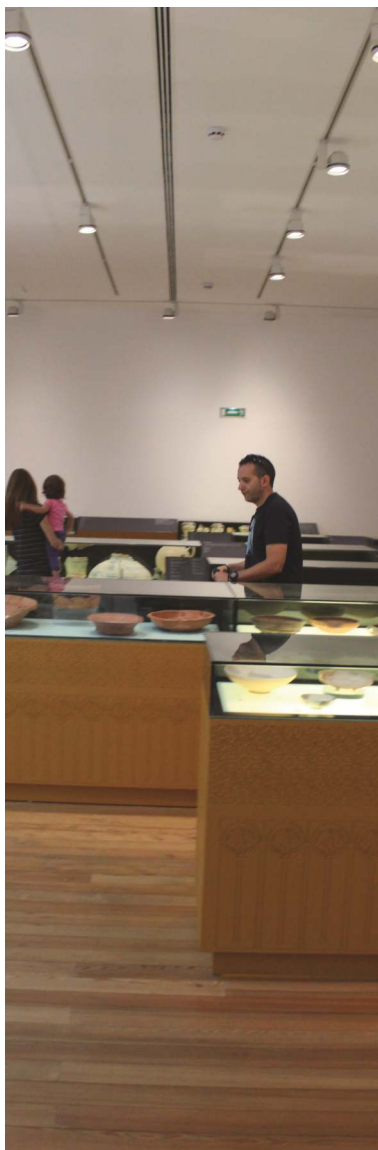
NÚCLEO ISLÂMICO ISLAMIC MUSEUM

EXPOSIÇÃO EXHIBITION PERMANENTE PERMANENT