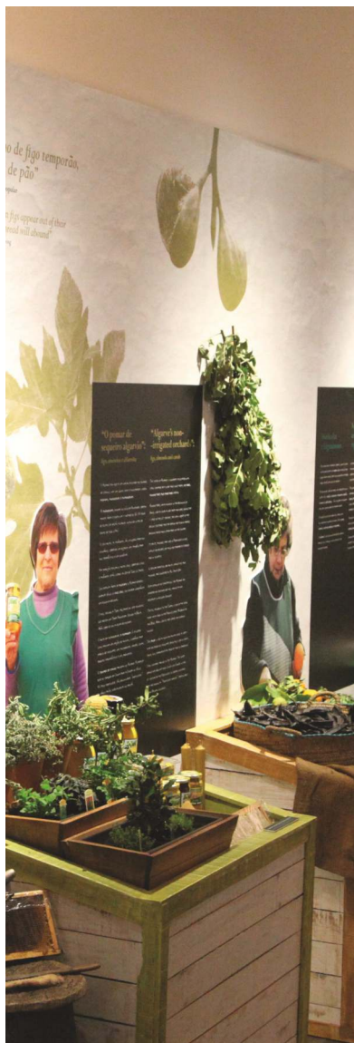
«DIETA MEDITERRÂNICA - PATRIMÓNIO CULTURAL MILENAR» «MEDITERRANEAN DIET - ANCIENT CULTURAL HERITAGE»