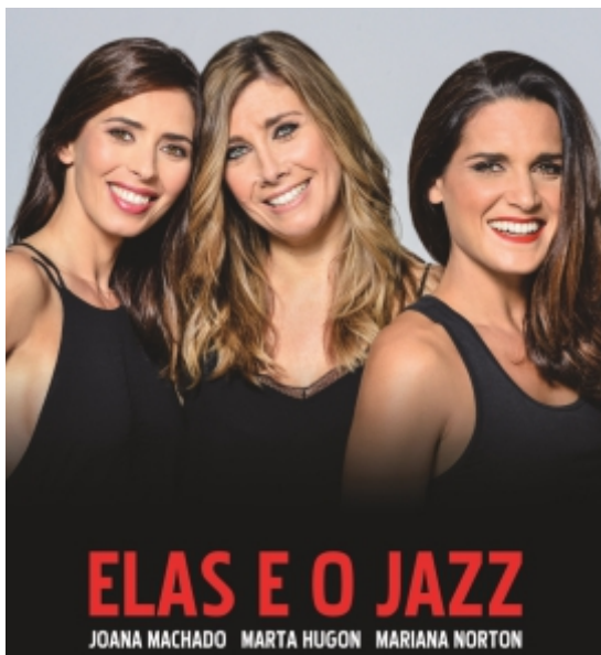
19 de julho ELAS E O JAZZ