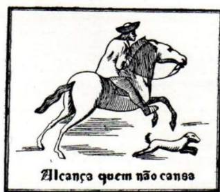
Ex-libris de Aquilino Ribeiro

Agora em que o país está desconfinamento (devido à pandemia) é salutar continuar a dar atenção à informação que nos vai chegando da direção geral de saúde, através da comunicação social e, sobretudo respeitar os preceitos sugeridos. Continuamos a observar que as expressões proverbiais ecoam nas mais diversas vertentes. Desta vez, e muito recentemente, ouviu-se na RTP1, no Telejornal de domingo, do dia 24 de maio 2020 pelas 20 horas, aquando do painel de comentadores João Soares e Poiães Maduro. E a propósito da escolha de um escritor, Aquilino Ribeiro foi um dos eleitos pelo comentador João Soares que referiu o provérbio: Alcança quem não cansa , ex-libris do mesmo escritor. No ex-libris de Aquilino Ribeiro figura um cavaleiro a galope, acompanhado do seu cão, tendo por divisa “Alcança quem não cansa”. O desenho, original é de Leal da Câmara 1 .